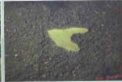
GABON Vue du ciel prise dans le Forêt