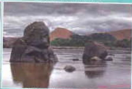
La Lope le Mont Broze et les Roches