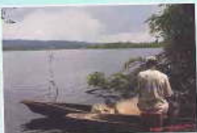
Lembah Lina Loo Atnggo Vilego Ibbat Pocheur