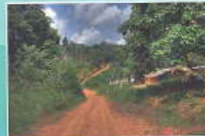
Orchestré, le village éternel