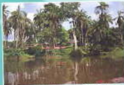
Lembah Lina Hutanul Schweber Yaka its Pileum