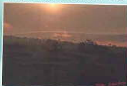
Kakigi Loo Nungui au Lever de Soleil