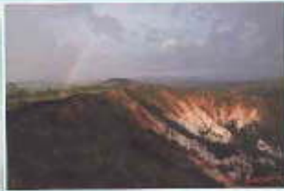
Canyon blanc et arc en ciel