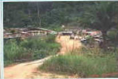
Chellu N'abo Village