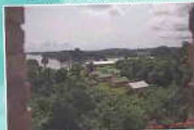
Lembah Lina Madaun Ngomir Eglid Vun du Glocber