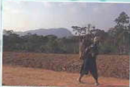
Bounji le Mont et Fillette Révendant de la Plantation