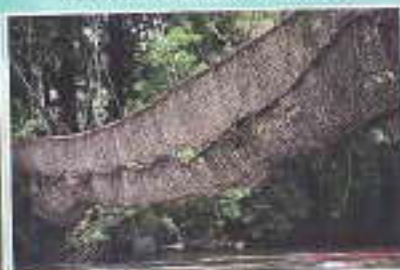
Pochur Vilego Prit