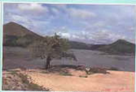
La Lope Les Fontes de Okanda