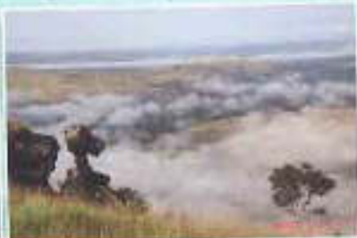
Neni Kulek Pochur Tete ds Chien Nuegen