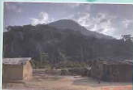
Ibounji le Mont au Village Bouissabi