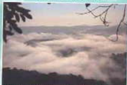
Ibounji Mer de Nuages sur la Forêt Vue du Mont le Mont