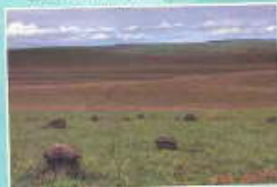
Panorax Bityika S Sarano of Teretben