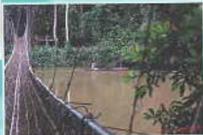
Arbres aux racines et pirogue