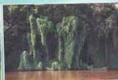
Lembah Lina Madaun Ngomir vegetation sur ds Pileum